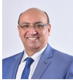
أ.د/ محمد عطية محمد البيومى نائب رئيس الجامعة لشئون التعليم والطلاب