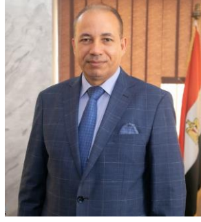
أ.د/شريف يوسف خاطر رئيس جامعة المنصورة